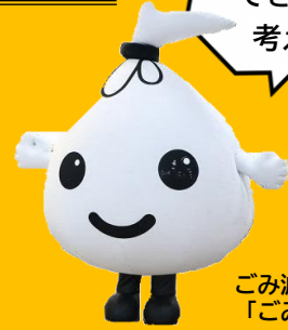
ごみ減量キャラクター 「ごみのん」