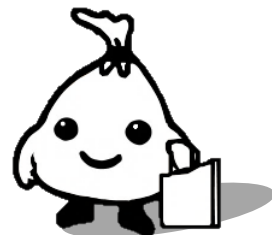
ごみ減量キャラクター 「ごみのん」